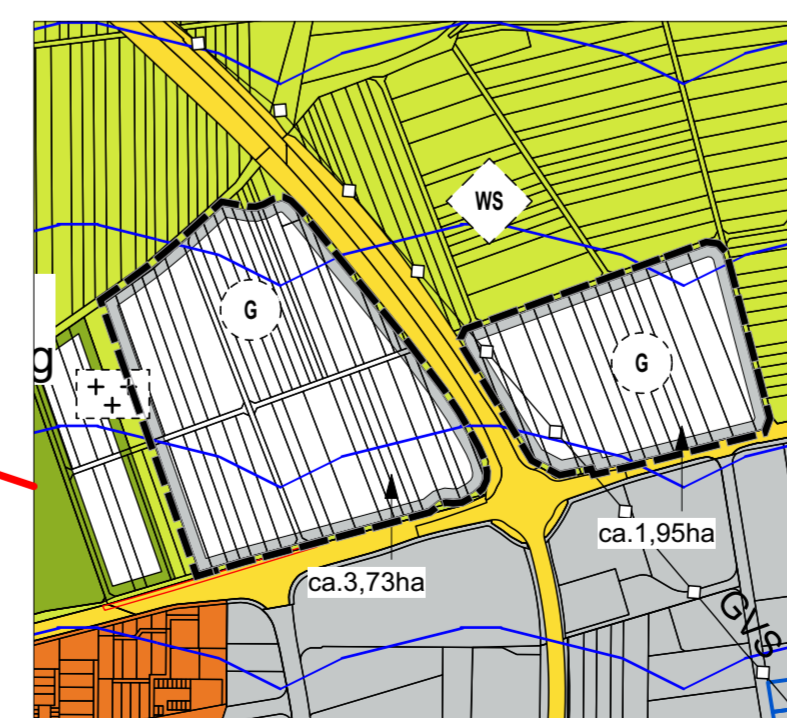
ZOOM 2. Änderung FNP ohne Maßstab