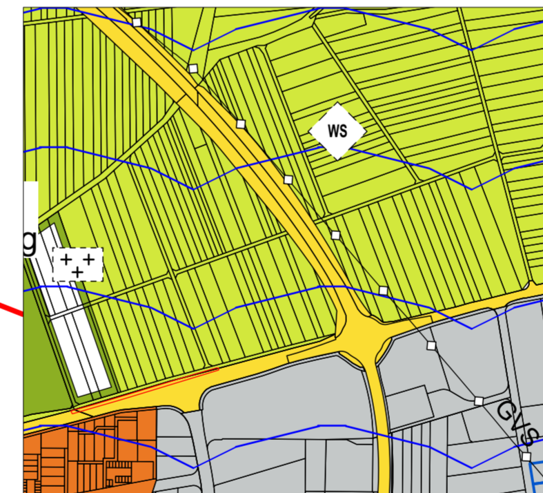
ZOOM genehmigter FNP ohne Maßstab

Ausschnitt mit Darstellung der Änderung zum Bebauungsplan "Gewerbegebiet Gebersheimer Weg"